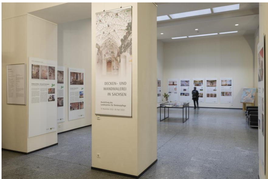
Blick in die Ausstellung im Ständehaus, 2022/2023