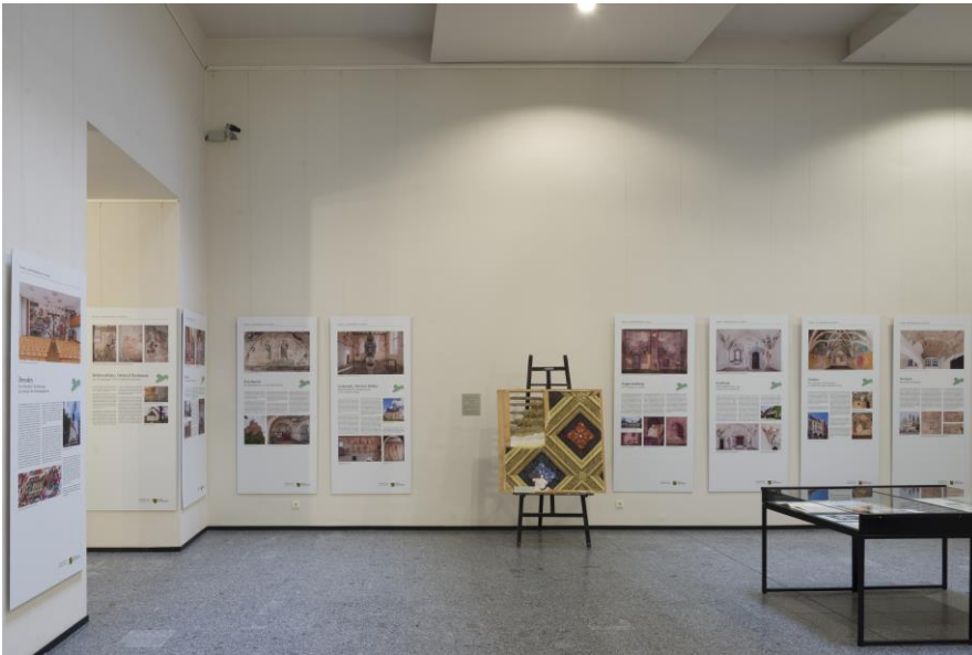
Blick in die Ausstellung im Ständehaus, 2022/2023