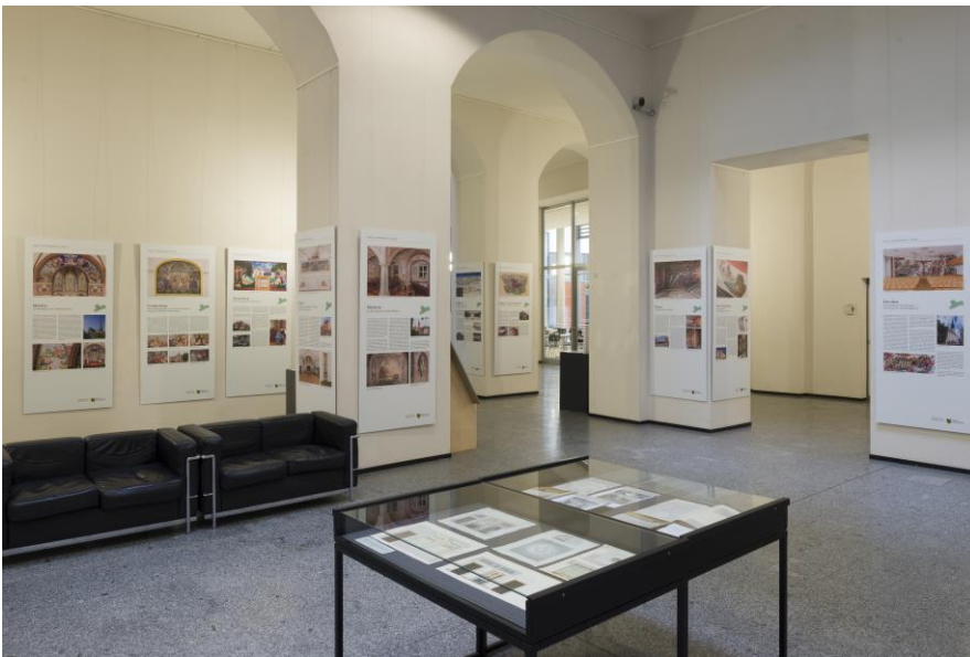
Blick in die Ausstellung im Ständehaus, 2022/2023