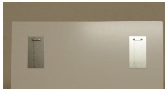
Detail Aufhängung Rückseite Tafeln